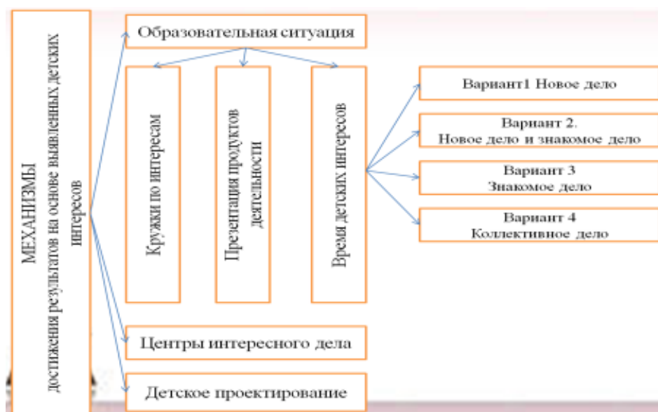
Схема Модели развития предпосылок индивидуализации детей дошкольного возраста.

В основе Модели организация совместной деятельность взрослого и детей. Особенностью совместной деятельности является целенаправленная заранее спроектированная образовательная ситуация, ориентированная на определение детьми практической задачи собственной деятельности, имеющей образовательный результат (продукт). Такие продукты могут быть как материальными (рассказ, рисунок, поделка, коллаж, экспонат для выставки), так и нематериальными (новое знание, образ, идея, отношение, переживание). Главными задачами таких образовательных ситуаций являются формирование у детей новых представлений и умений в разных видах деятельности, обобщение знаний по теме, развитие способности рассуждать и делать выводы. Ориентация на конечный продукт определяет технологию создания образовательных ситуаций в совместной деятельности педагога и детей дошкольного возраста